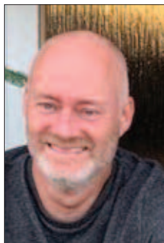
Skrevet af PER JUEL