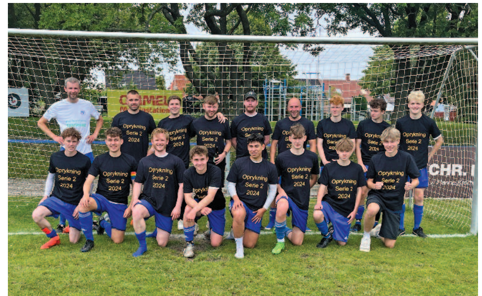
De unge gutter på 2. holdet i serie 3 sluttede på en flot 3. plads som gav oprykning til serie 2 fra efteråret 2024. – ET STORT TILLYKKE skal lyde fra »Mod Nye Mål«.